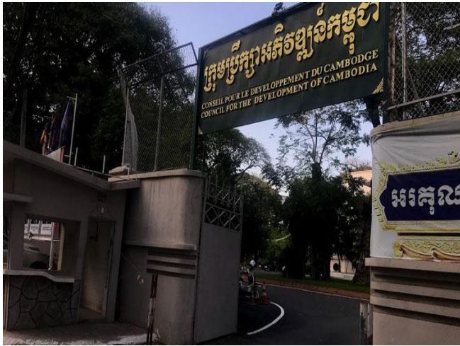
ប្រភព៖ Khmer Times ២០២១, រូបភាព៖ KT/Husain Haider

កាលពីថ្ងៃសុក្រ សប្តាហ៍មុន ក្រុមប្រឹក្សាអភិវឌ្ឍន៍កម្ពុជា (CDC) បានអនុម័តទឹកប្រាក់ប្រមាណ៧០លានដុល្លារ សម្រាប់ការវិនិយោគរបស់រោងចក្រថ្មីៗ ចំនួន ៧ ដែល អាចផ្តល់ការងារជូនប្រជាពលរដ្ឋបានជាង ២ ៦០០ កន្លែង។